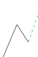
بازار در حال ایмпالس بعد از یک اصلاح است