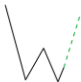
یک کف دو قلو در حال تشکیل است، بازار از کف قبلی در حال برگشت است