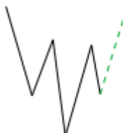
یک الگوی سر و شانه معکوس در حال تشکیل است